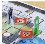
忍の武器を使った攻防! Use Ninja Weapons!