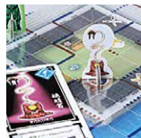
「宝守」の妖怪を召喚! Summon the Specters!