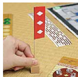
陣旗を揚げ、いざ帰陣! Fly the Base Flag!