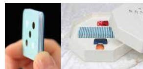
[2023NEW] 新しいフラッグシップ 匠のアート版“雪”

日本のペーパークラフト職人による美しいゲームコンポーネント! 全6エディションのプロダクトラインナップ