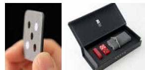
自然な風合いの手触りが魅力 クラシック版