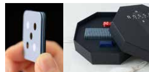
職人技が光る9層構造のタイトル 匠のアート版“水”