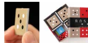
コンパクト&カジュアル スタンダード ネオ版