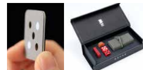
[2023NEW] ナチュラルな素材感 クラシック ネオ版