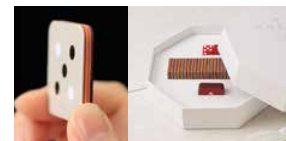
花畑をイメージした断面の華やかな 匠のアート版“花”